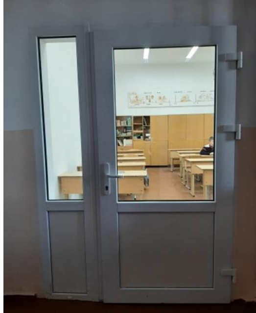
Ремонт кабинета математики и истории