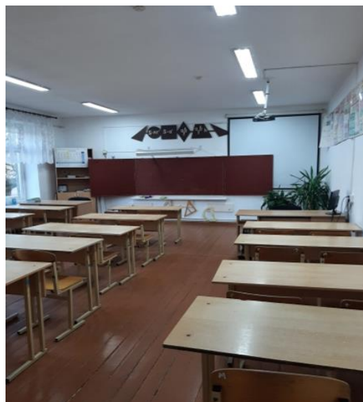
Приобретение мебели в кабинет физики