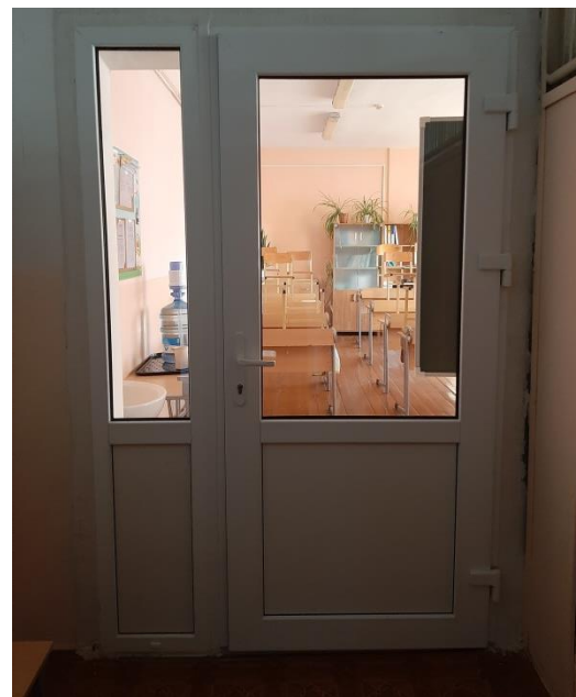
Замена 2-х дверей в кабинете математики и истории